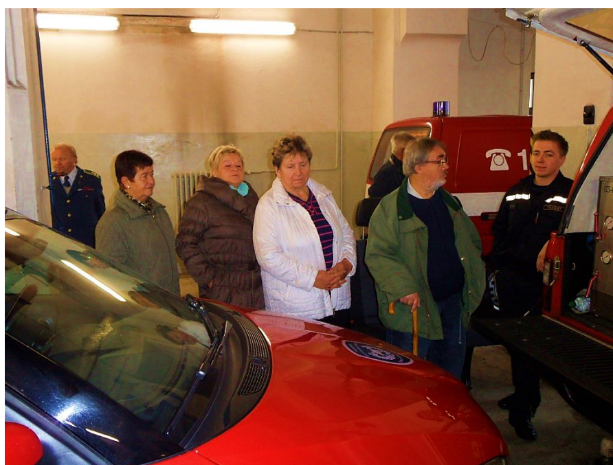
Prohlídka haly hlavní požární stanice Praha 1.