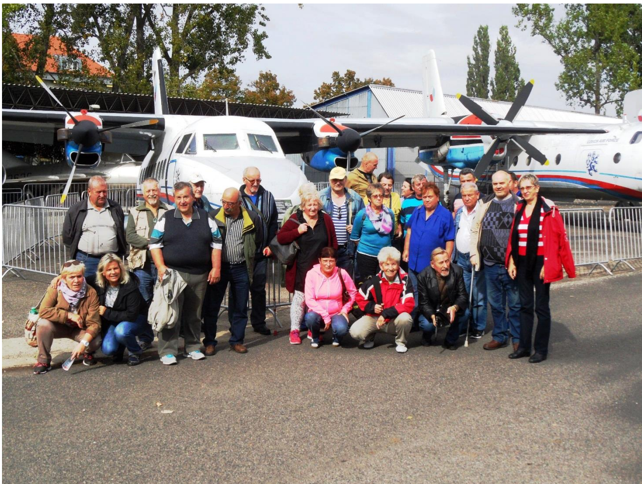
Hromadná fotografie účastníků zájezdu.