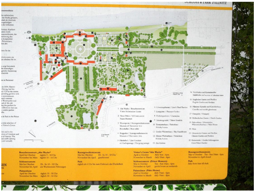
Plánek zámku Pilnitz.