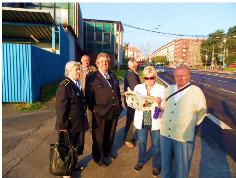
Příprava k odjezdu

Soustředění účastníků před kostelem Nanebevzetí v Mostu. Po prohlídce kostela následoval přesun na letiště.