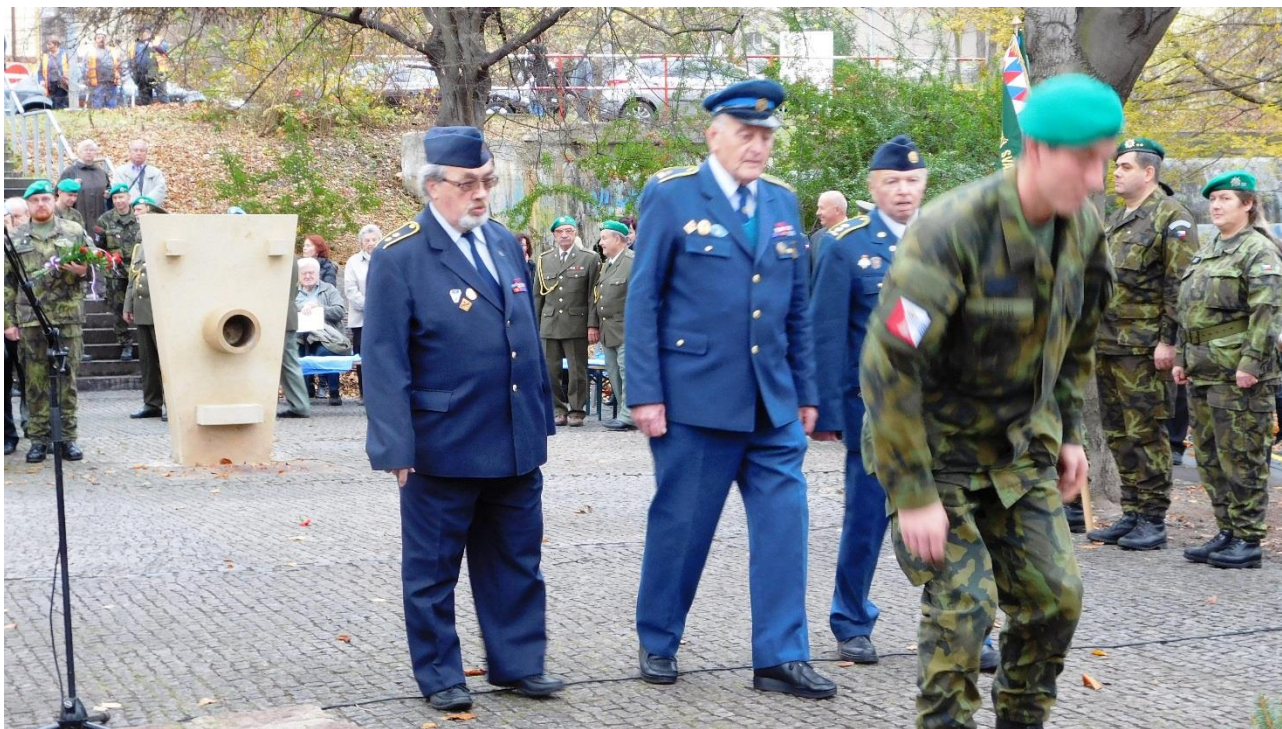
Delegace Zasloužilých hasičů klade kytici k pomníku válečných veteránů.

Zasloužilí hasiči se poprvé zúčastnili tohoto slavnostního aktu, spolu se zástupci Klubu vojenských důchodců a Vojenského sdružení rehabilitovaných.