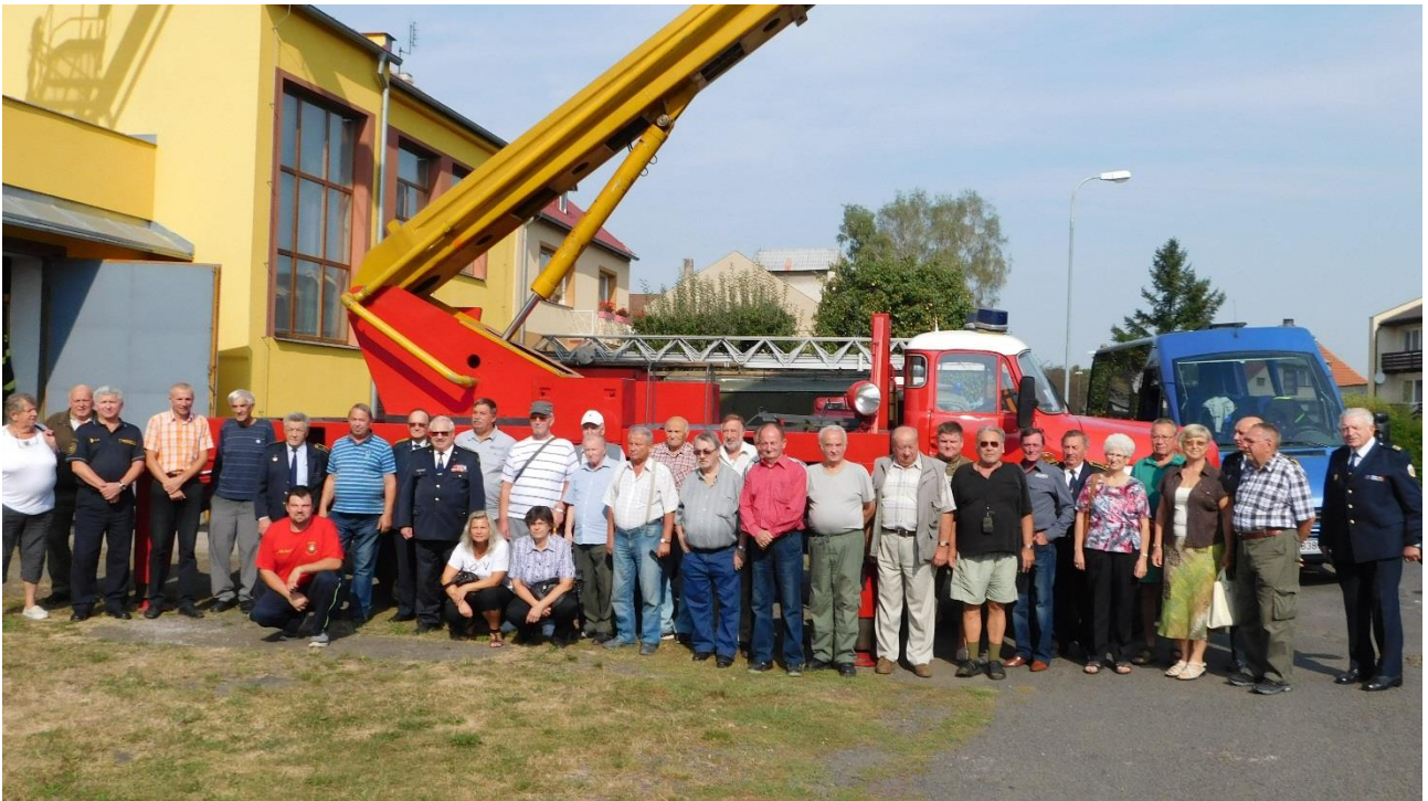
Hromadná fotografie účastníků setkání