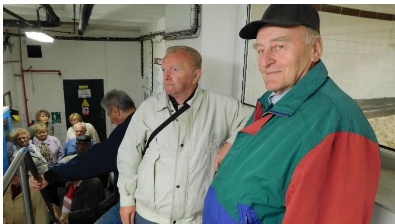
U nádrží se zrajícím pivem.