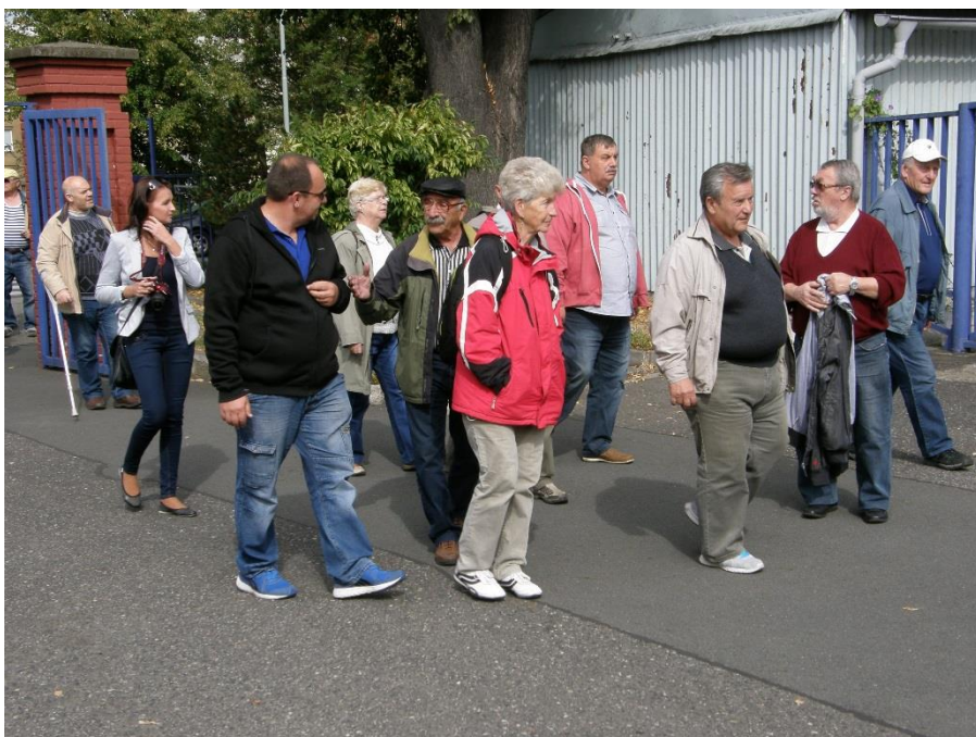
Příchod na nejstarší pražské letiště ve Kbělích.