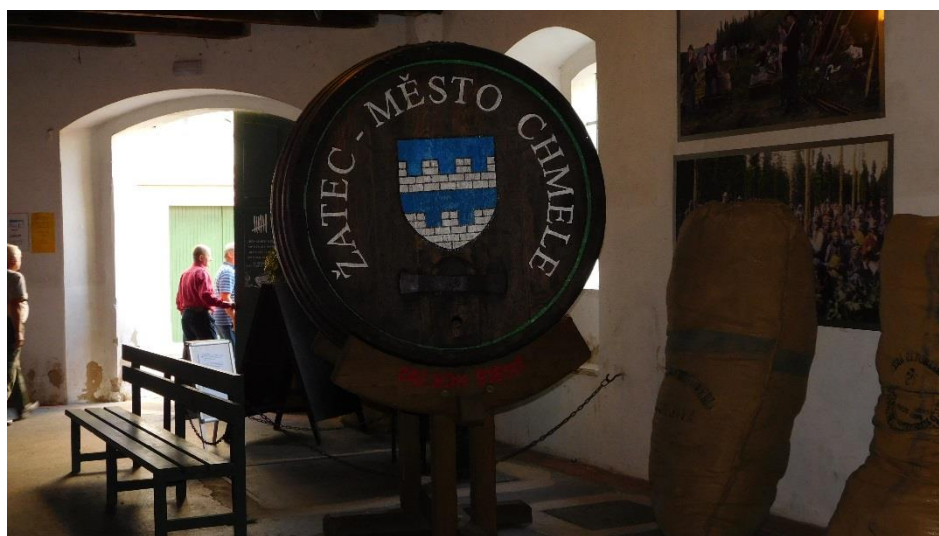
Poté následovala prohlídka Muzea pivovarnictví a shlédnutí města Žatec z 36 metrů vysoké vyhlídkové věže.