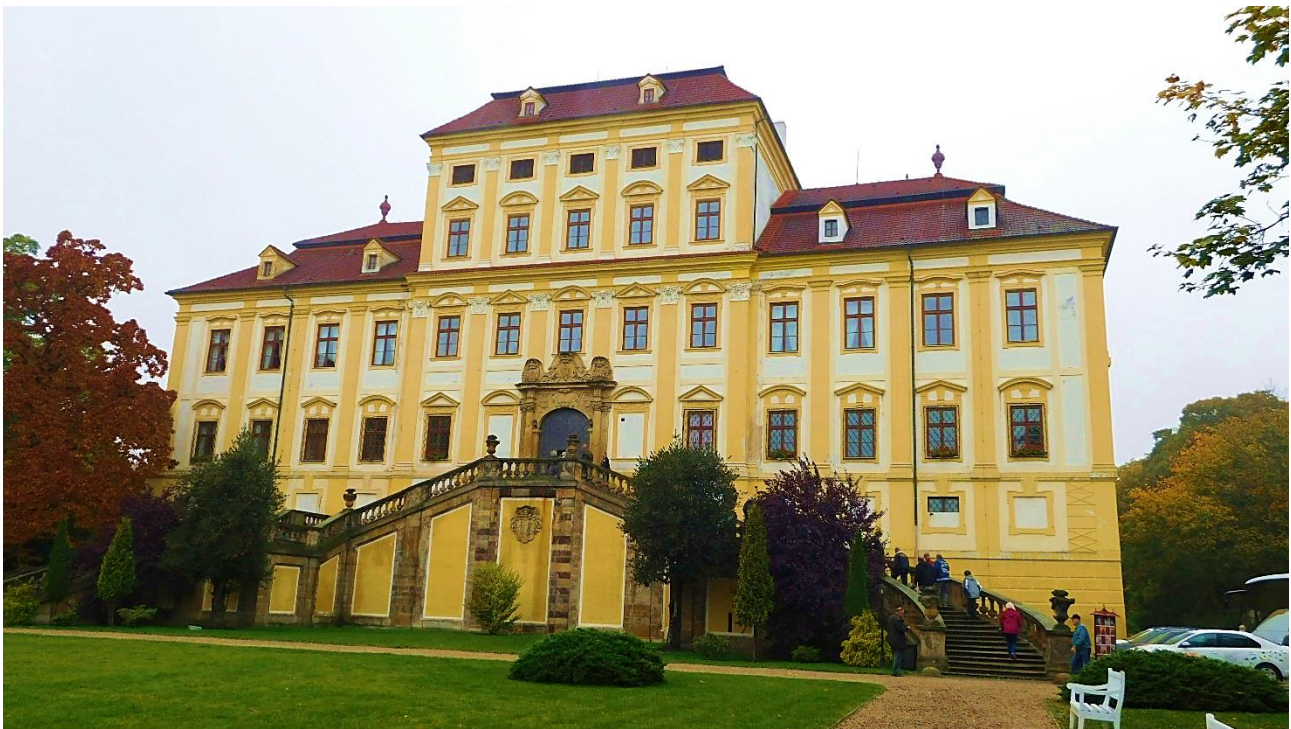
Po skončení odborné části jsme se přesunuli na zámek Červený hrádek, kde setkání Zasloužilých hasičů pokračovalo částí společenskou, prohlídkou zámku a obědem.