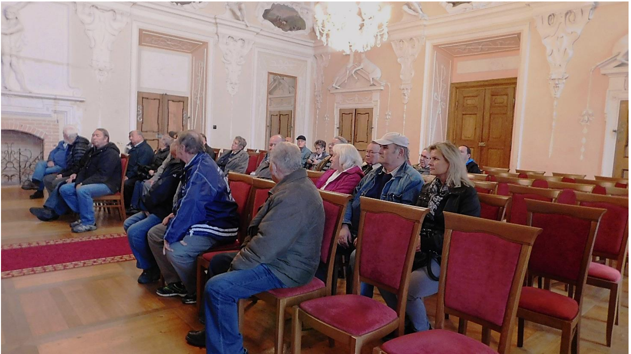
V této zámecké síni se konají různé společenské události, svatby, koncerty a další.