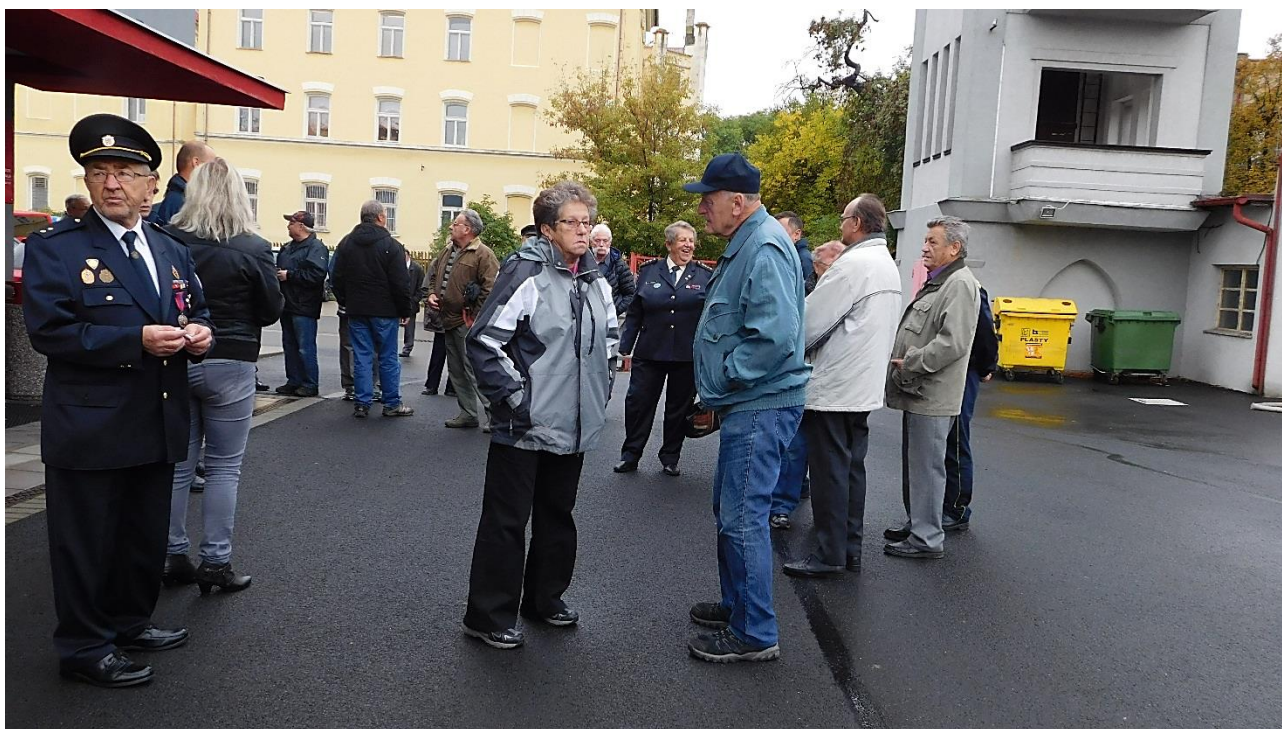
Příjezd na útvar HZS Chomutov.