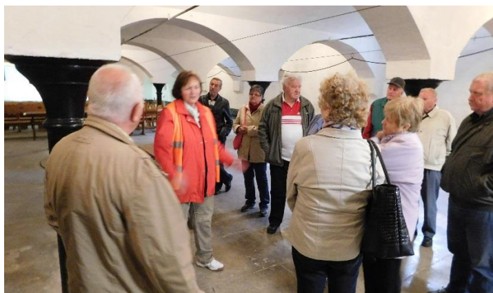
Historický pivovarský sklep.