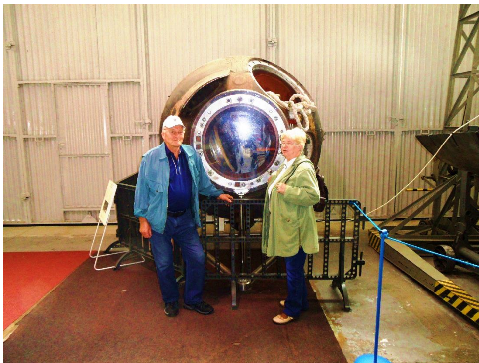
U sovětského přistávacího modulu (kabina pro kosmonauta).