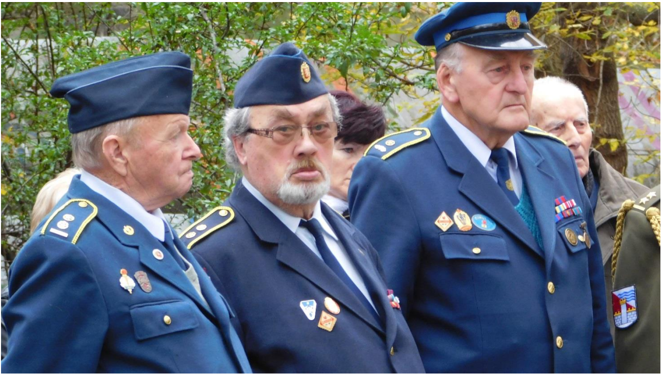
Členové delegace Zasloužilých hasičů.