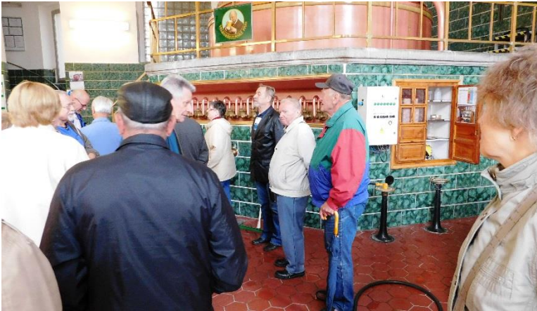
V technologické části pivovaru.