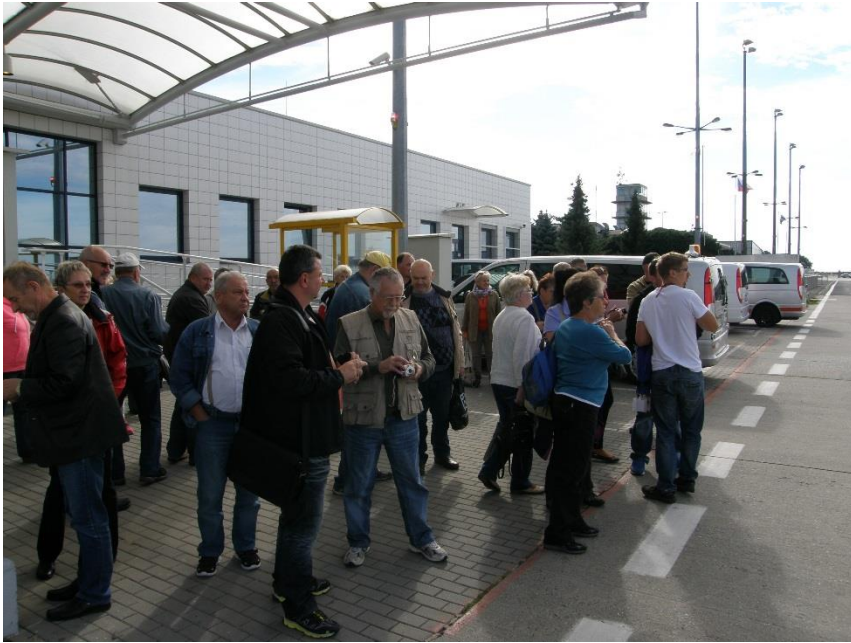
Čekání na autobus průvodce.