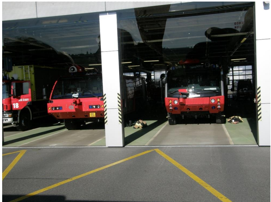
Pohled do garáže požárních vozidel letiště.