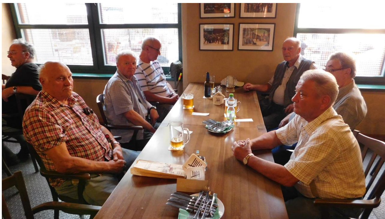
Závěr setkání, včetně oběda, proběhl v přilehlé restauraci.