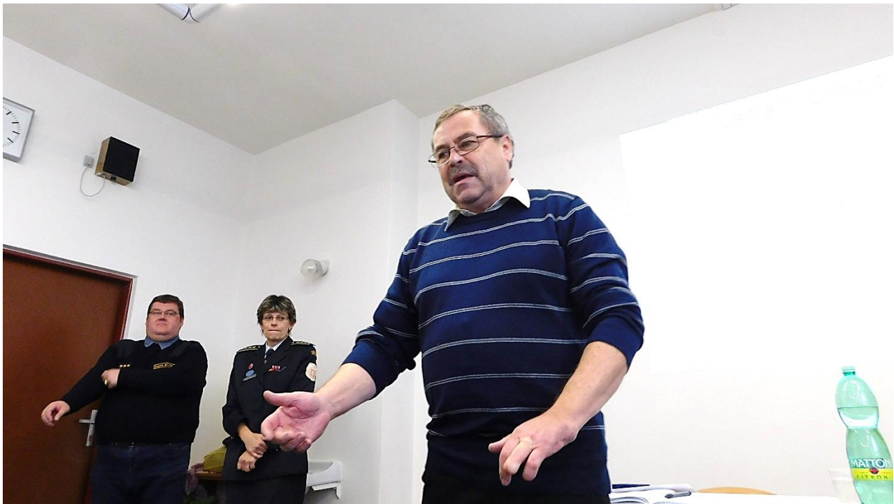
Na závěr návštěvy školy bylo provedeno vyhodnocení odborné části setkání.