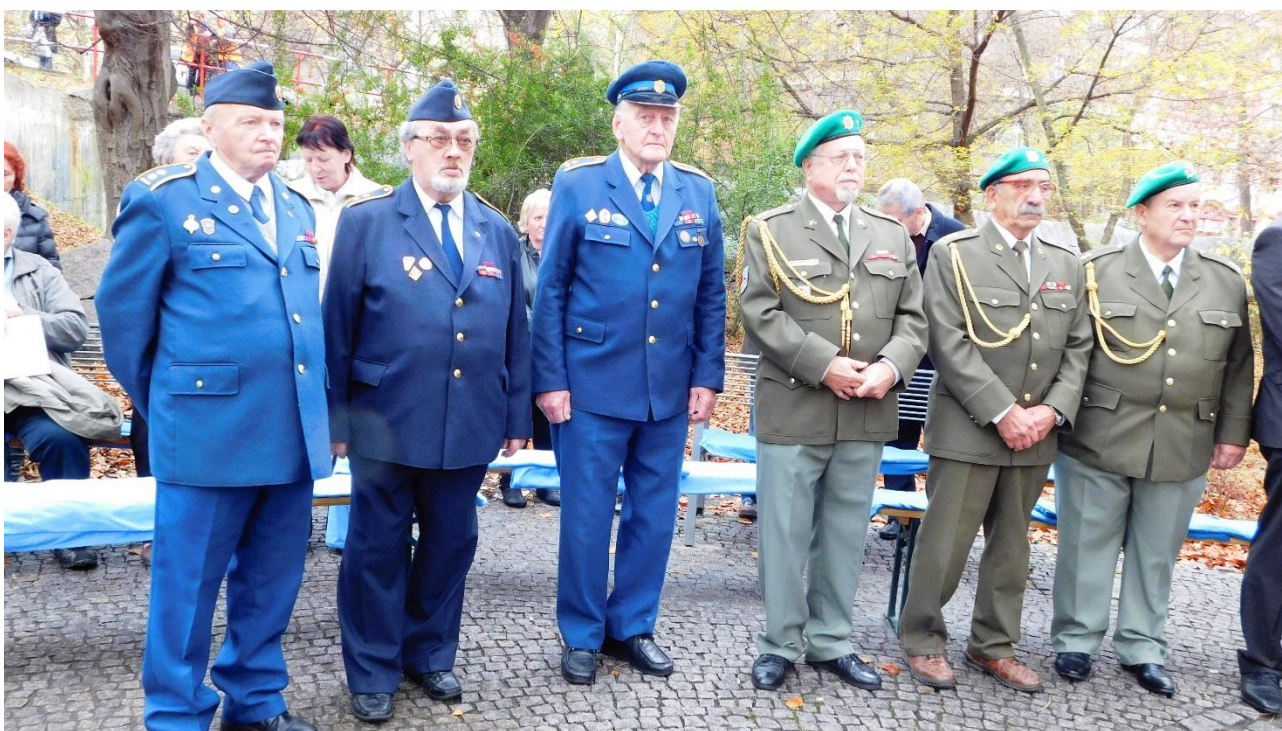
Společně s vedením Klubu vojenských důchodců.