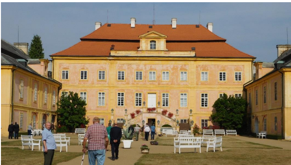
Následovala prohlídka zámku Krásný dvůr.