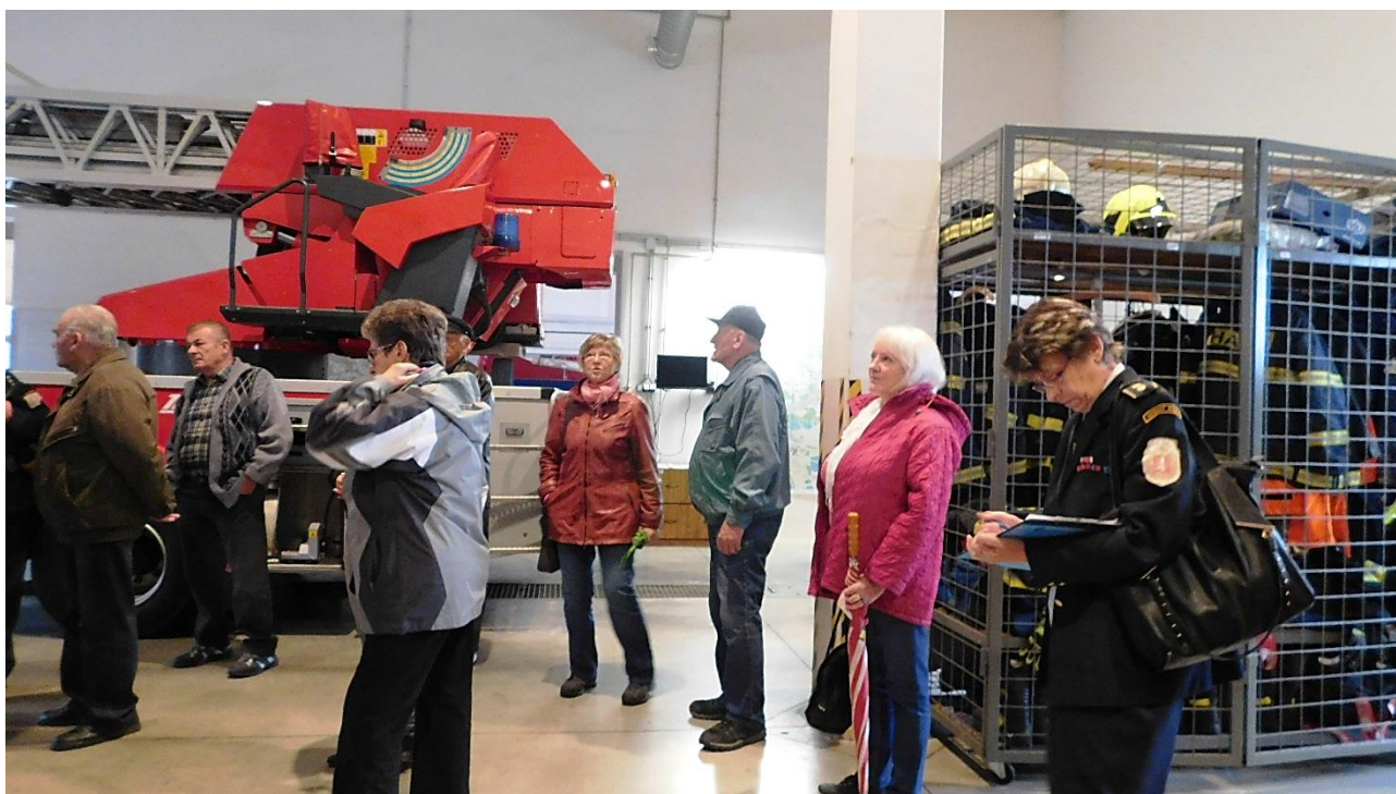
Prohlídka prostor útvaru.