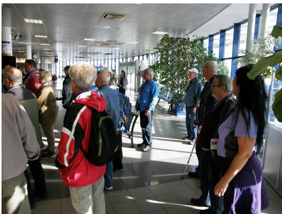
Terminál č. 3, čekání na průvodce.