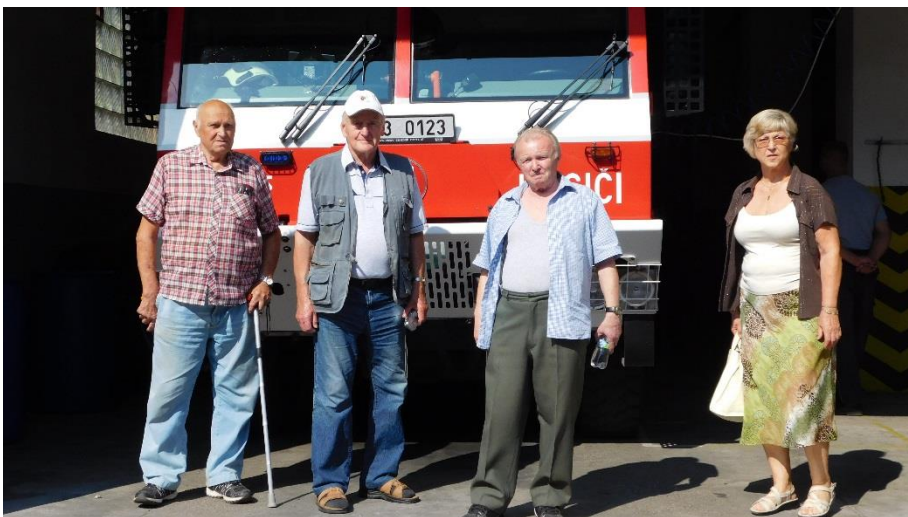
Po prohlídce zámku se účastníci přesunuli na Požární stanici HZS v Žatci.