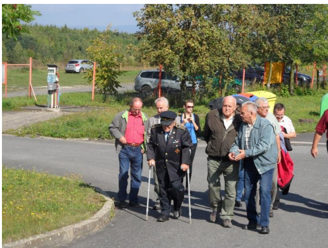
Příchod na letiště.

Z letiště se účastníci přesunuli na Hipodrom v Mostu, kde jim byli předvedeni závodní koně a malé plemeno koní.