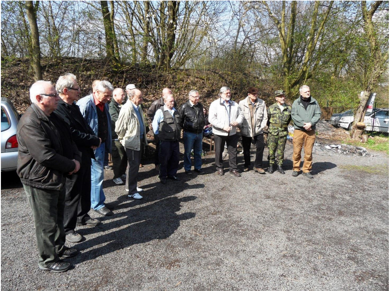
Účastníci nastoupeni k závěrečnému vyhodnocení střelb.