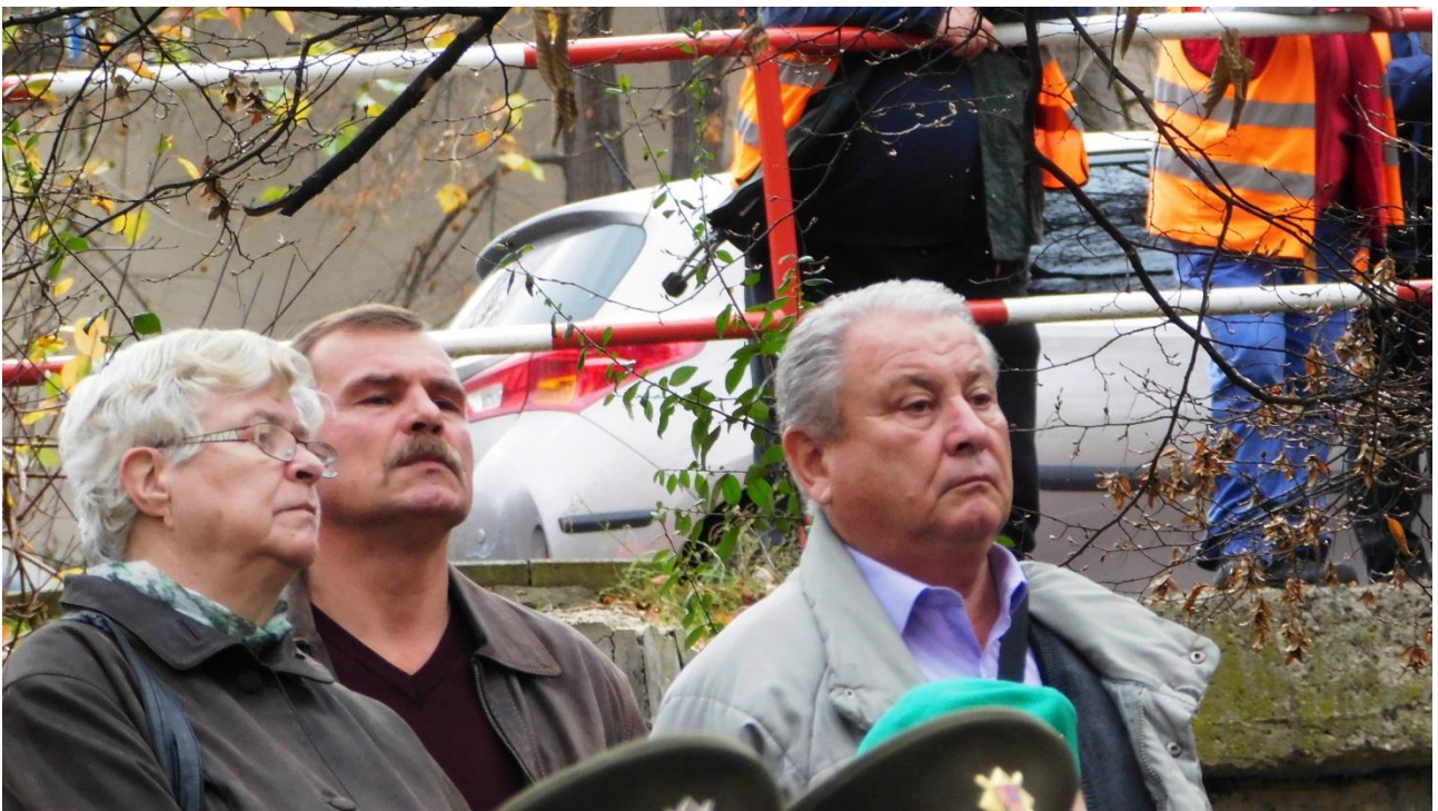
Slavnostního aktu se zúčastnili také další dobrovolní hasiči.